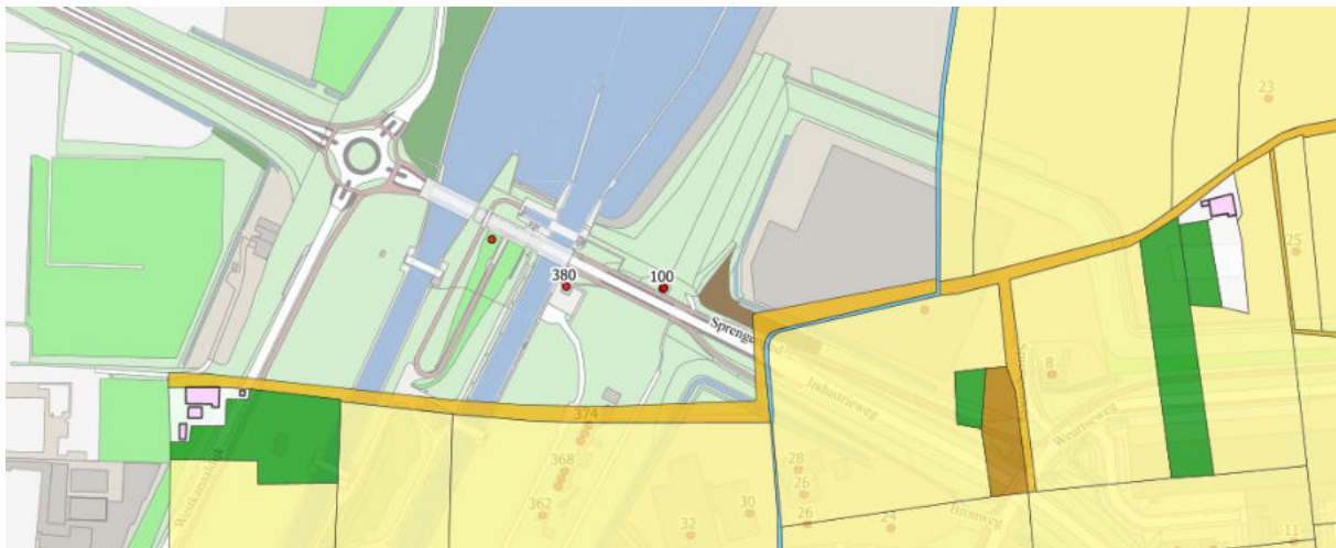
Basisregistratie Grootchalige Topografie (BGT) - kadastrale grenzen (1832) (gedeelte)

Op de tekening is de noord- en zuidkant van de Industrierweg (nummers 2 t/m 44 en nummer 5 t/m 75) niet betrokken. Tot nu toe behoren de parallelwegen tot de bestaande openbare ruimte. De Industrierweg eindigt ook nog steeds bij de toenmalige grens van de gemeente Nijmegen.